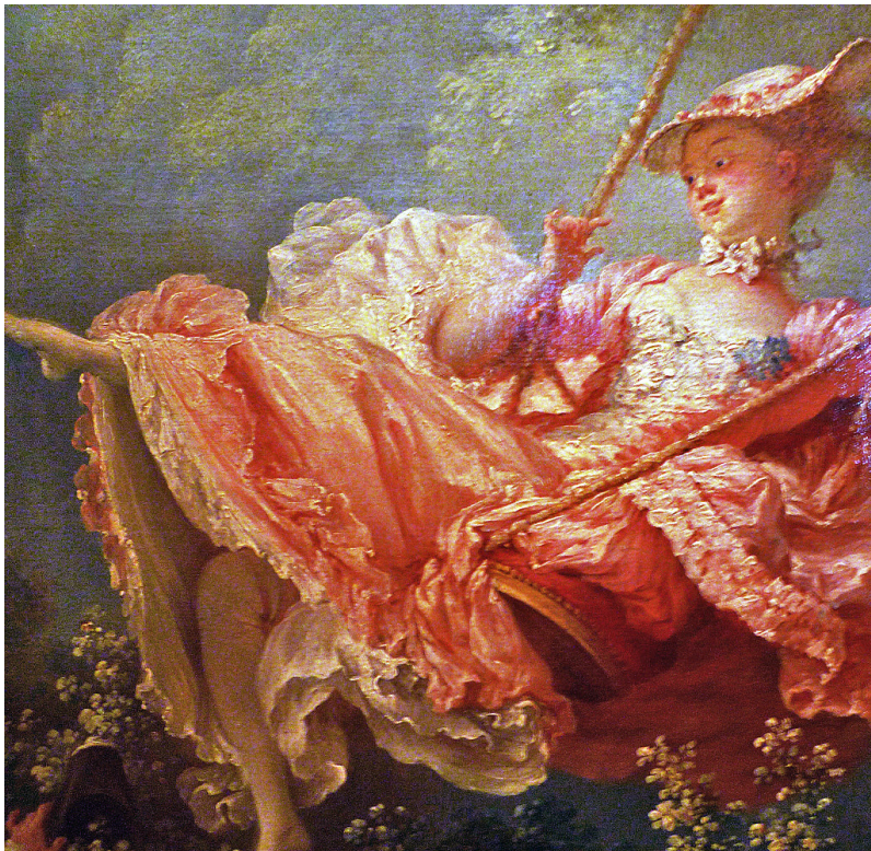
Dettaglio n. 2