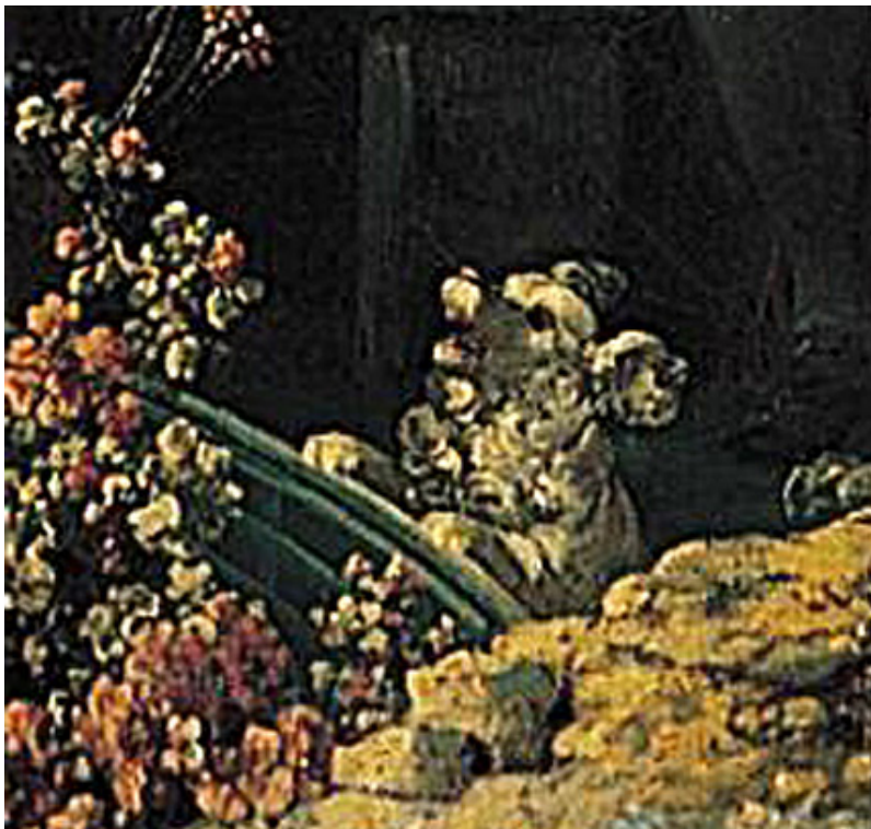
Dettaglio n. 1