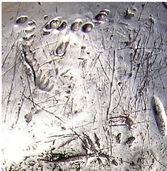
Издвојени део детаља